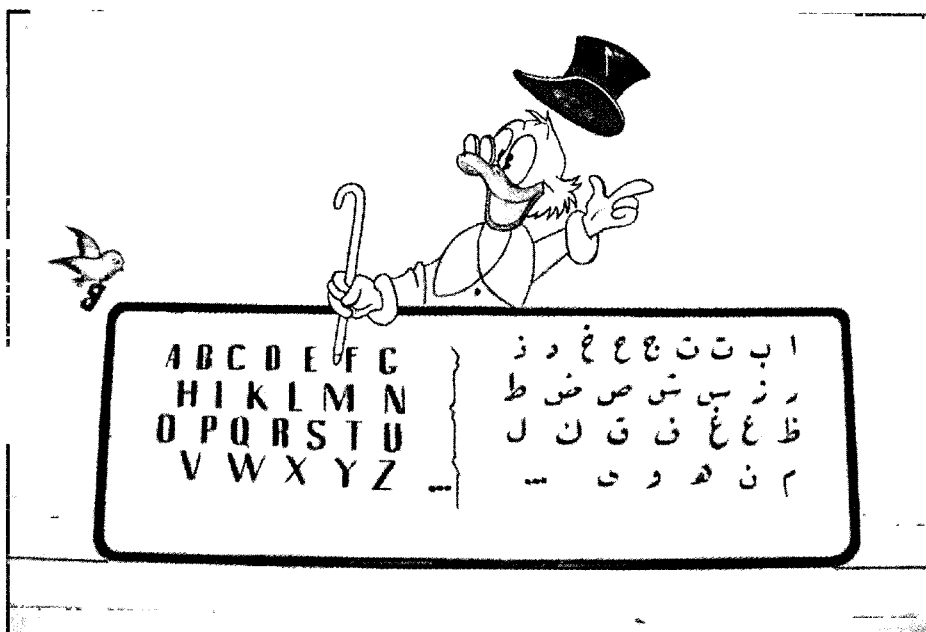
De stripfiguur Dagobert Duck lijkt te willen zeggen dat het geluk te vinden is in de westerse wereld.

plaatsvervangend secretaris-generaal van de raad. Vanuit Beiroet worden conferenties georganiseerd om de nieuwe ontwikkelingen in de Oosterse kerken te bespreken. Daarnaast worden